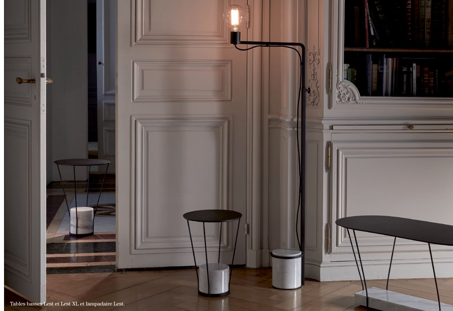
Tables basses Lest et Lest XL et lampadaire Lest.

Nouvel éditeur de design intérieur, Radar, créé début 2016 et basé à Lille, se distingue avec des collections de petits mobiliers, de luminaires et d'accessoires pour la maison aux lignes épurées, voire minimalistes.